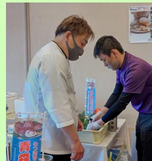
ポスターやのぼりでPR