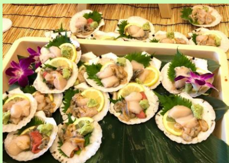
ヒモモ刺身で提供