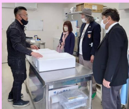
金亀水産（鮮魚） とよかわ農園（長いも）